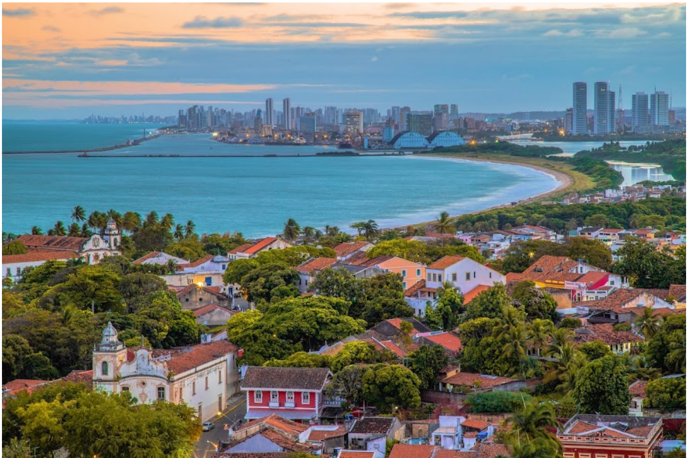
LINDA - MIRANTE